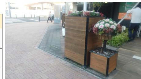
キタラ前コンテナ