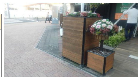
キタラ前コンテナ