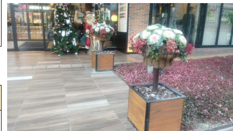
キタラ前コンテナ