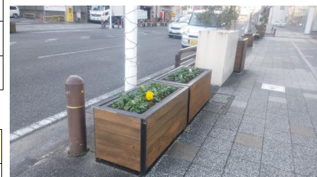
駅前商店街コンテナ