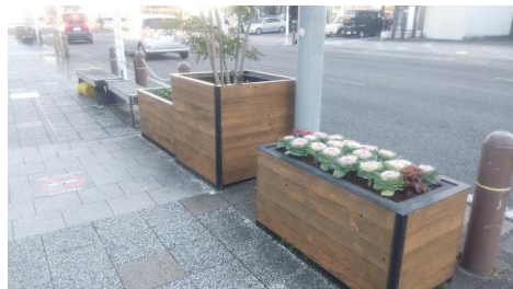
駅前商店街コンテナ