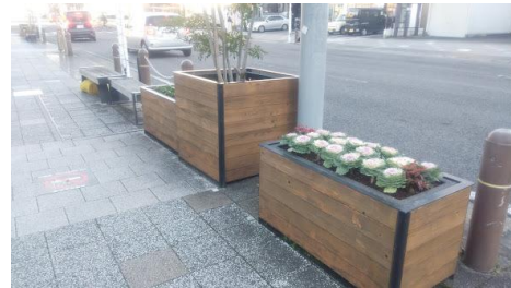
駅前商店街コンテナ