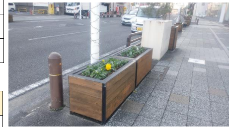
駅前商店街コンテナ